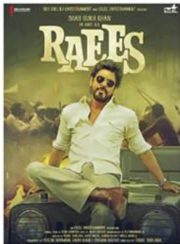
De Rahul Dholakia Avec Shah Rukh Khan, Mahira Khan, Sunny Leone 2017 - 2h41 - Policier - Hindi