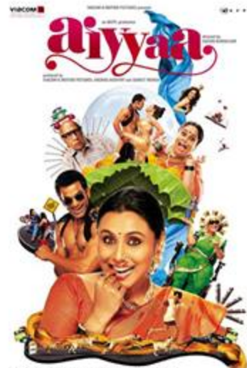
De Sachin Kundalkar Avec Rani Mukherjee, Prithviraj Sukumaran 2012 - 2h32 - Comédie - Hindi

Sorti le jour de la République, (tout comme Kaabil ), Raees figure parmi les films les plus attendus de l'année en Inde. Mahira Khan offre une présence lumineuse et remarquée, malgré les complications dans un contexte tendu entre Inde et Pakistan.